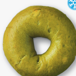
抹茶 ホワイトチョコ

"しっとり&もちもち"食感のプレーン生地にビターなセミスイートチョコチップを練り込みました。