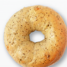
アールグレイ ミルクティー

栄養価の高いキヌア、アマランサスの他、合計15種の雑穀類をたっぷり練り込んだ、体にやさしい健康系ベーグルです。