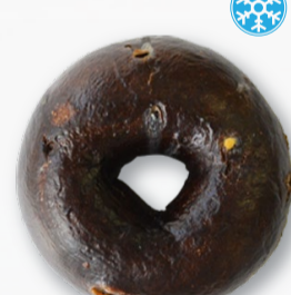
ココア ホワイトチョコ

宇治抹茶を使用したほろ苦い生地とミルクィなホワイトチョコの上品なハーモニーの"Japanese Bagel"です。