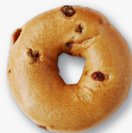
シナモン レーズン