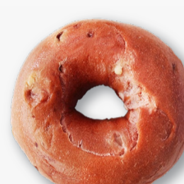
ストロベリー ホワイトチョコ