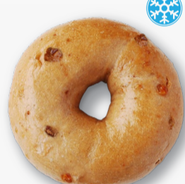
メープル ウォルナッツ